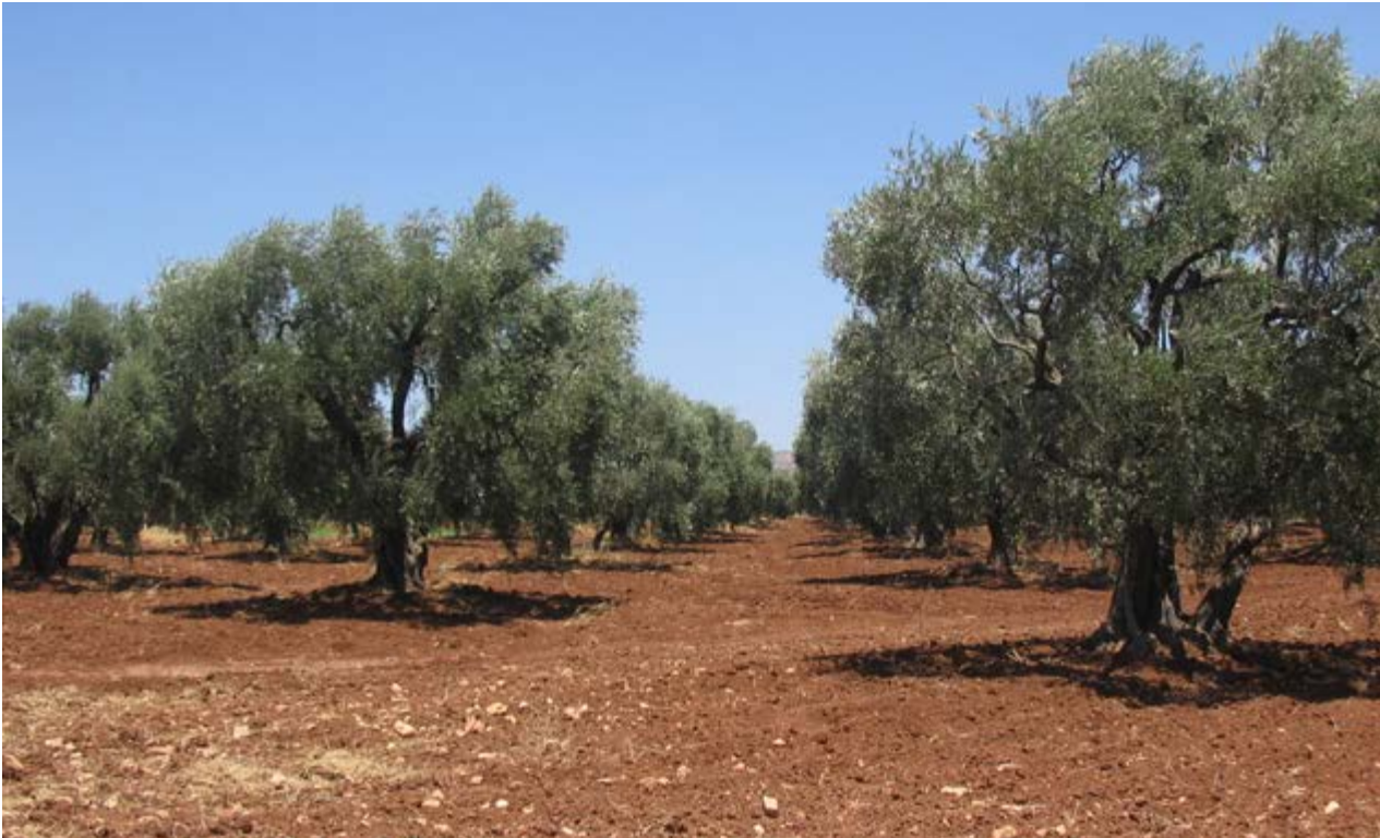
Oliveti tradizionali nella regione di Idlib, cuore storico dell'olivicoltura siriana.