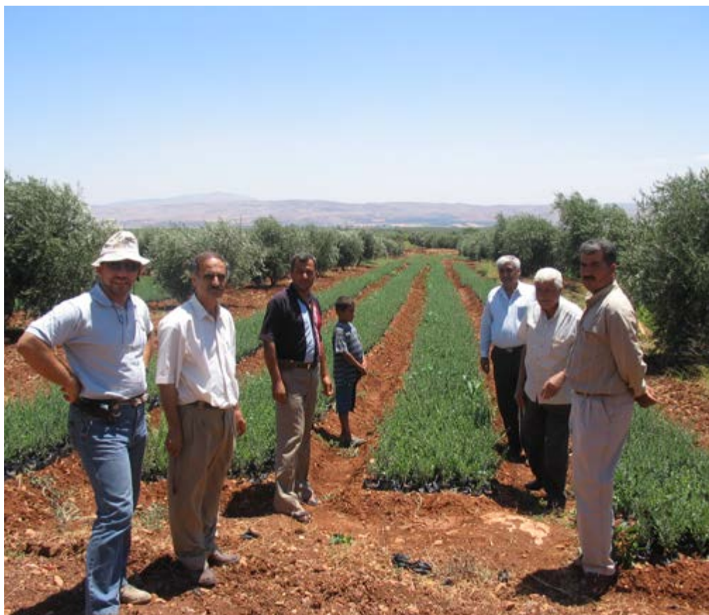
Visita tecnica in Idleb durante il progetto "Olio-Idleb 2006" del CIHEAM di Bari.

laboratori ufficiali e la certificazione delle esportazioni mediante analisi chimiche e sensoriali accreditate, quali garanzie dell'identità e della qualità dell'olio d'oliva siriano sui mercati mondiali.