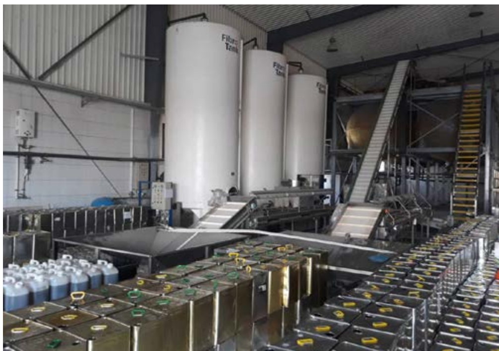
I Frantoi e linee di estrazione nel contesto siriano pre-conflitto.

Il conflitto ha determinato un calo significativo della produzione, imputabile a cause molteplici: i cambiamenti climatici, che hanno colpito duramente la produttività degli alberi; l'abbandono dei campi da parte di molti olivicoltori, in particolare nelle province di Idleb e Aleppo, a causa della guerra e degli sfollamenti forzati; le devastazioni